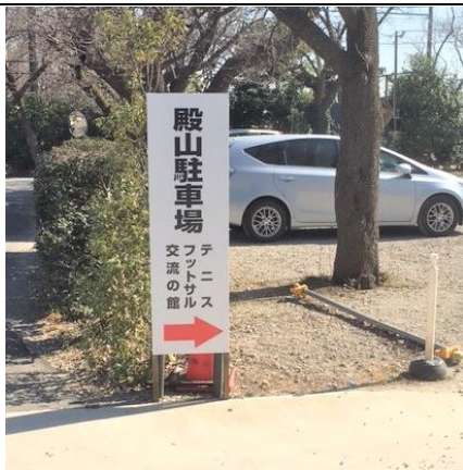
P5駐車場の入口案内版

●受付時刻の遅い選手がご来場する時は、すでに各コートで試合は進行中です。スムーズに交替し試合ができるよう、進行状況を見ながら準備をお願いします。